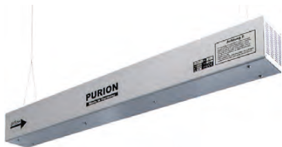
article number: 160 02100 0000