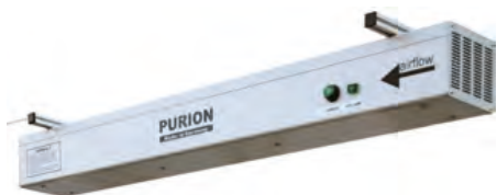
article number: 160 03800 0000