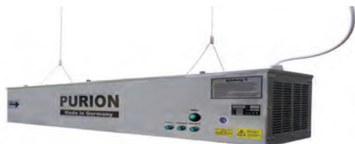
article number: 03600 0000