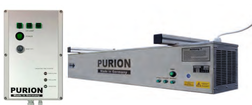
article number: 03701 0000