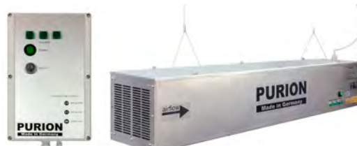
article number: 03600 0001