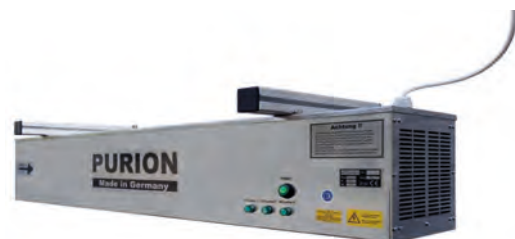
article number: 03700 0000